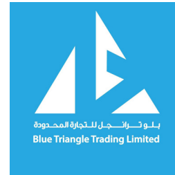
شركة بلو ترينجل للتجارة المحدودة