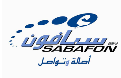
شركة سبأفون للاتصالات