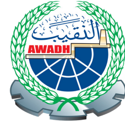
مجموعة شركات بن عوض النقيب