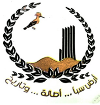
مصنع أرض سبأ