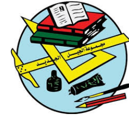
مجموعة الجيل الجديد