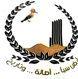
مصنع أرض سبأ